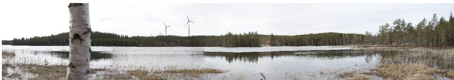
Fotomontage från norra stranden av Lilla Björnmossen

Vindkraftparken kommer att dimensioneras enligt gällande riktvärden för skugg- och ljudutbredning. Inga konkurrerande riksintressen eller oförenligheter med gällande översiktsplan bedöms föreligga.